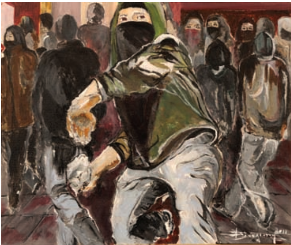
Θυμός και Φόβος Ακρυλικό σε καμβά, 50 x 60