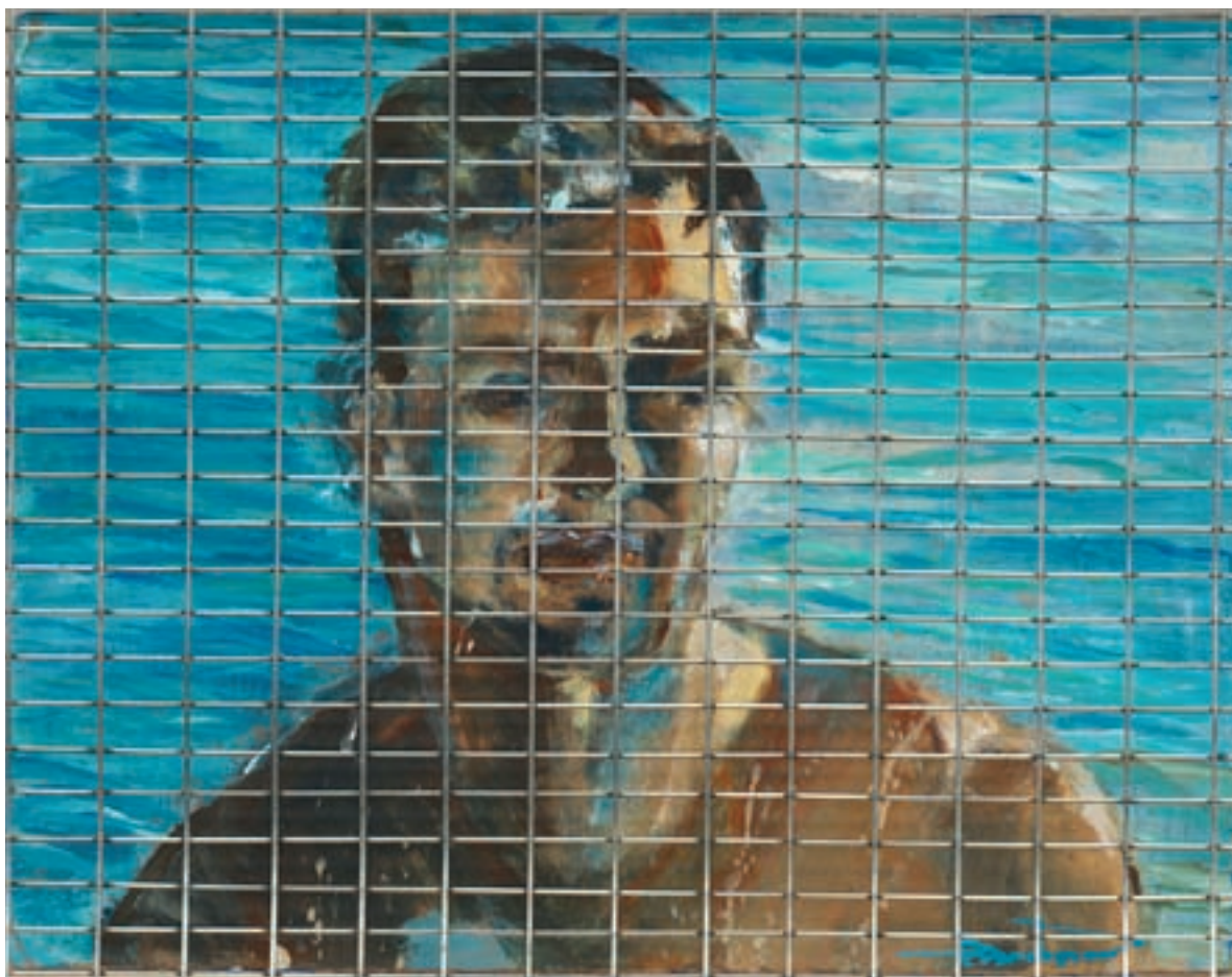
Εντός Ορίων ακρυλικό σε χαρτόνι συσκευασίας, 50 x 40