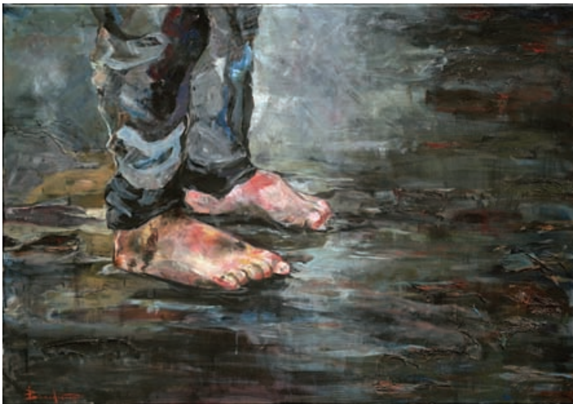
Καθ' οδόν ακρυλικό σε καμβά, 100 x 70