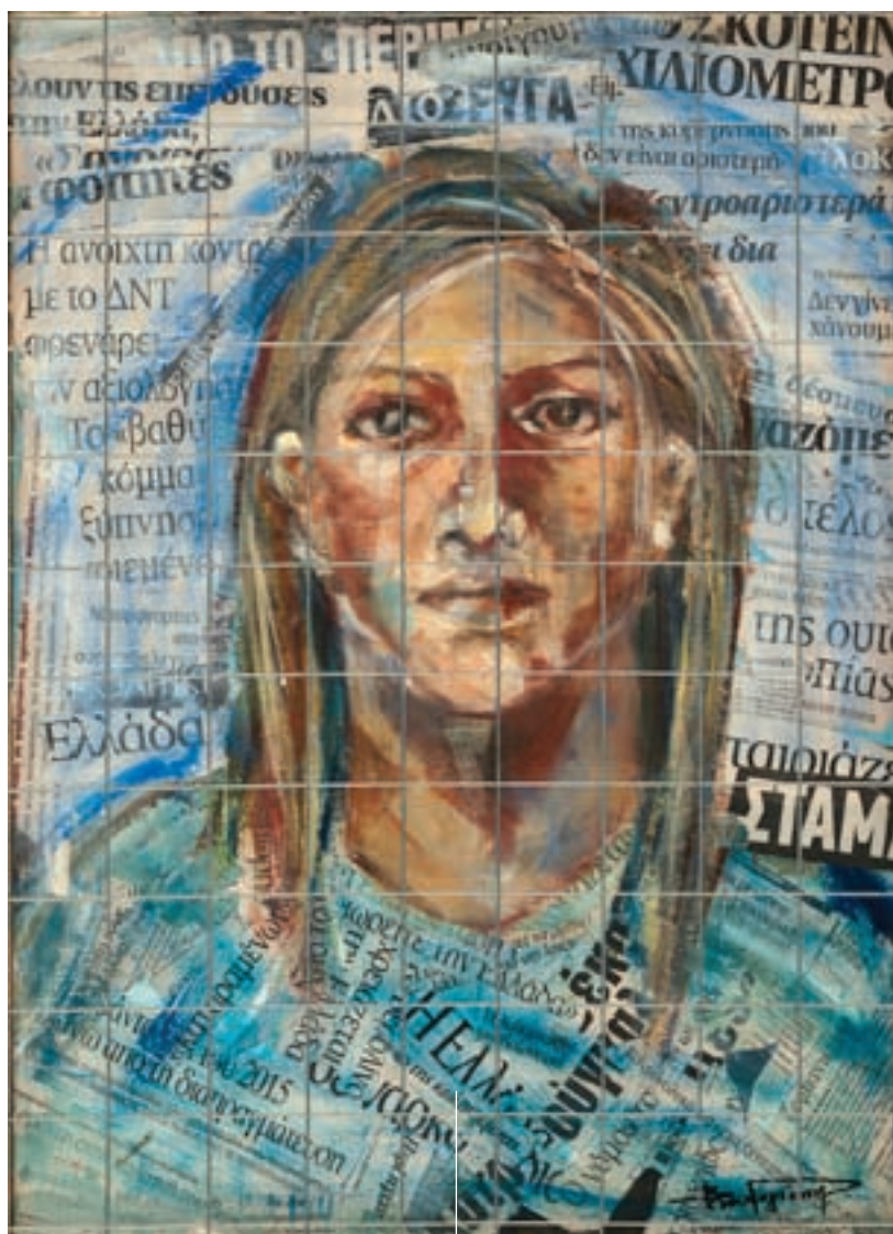
Επίγνωση ακρυλικό σε καμβά, 47 x 64