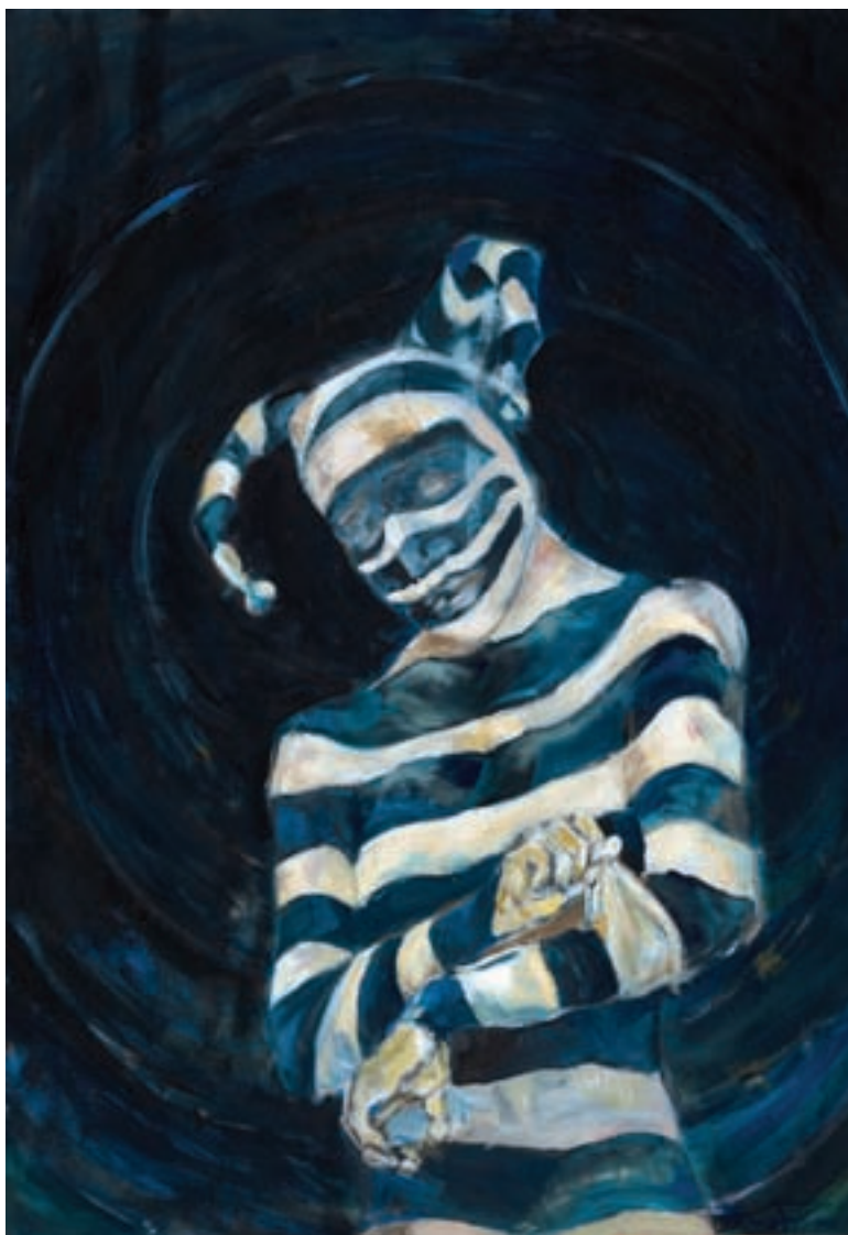
Δυσανεξία Εαυτού ακρυλικό σε καμβά, 70 x 100