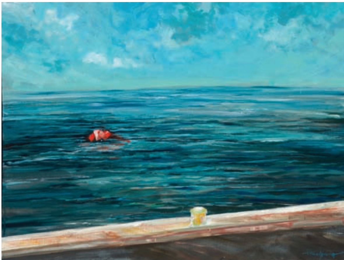
Στίγμα ακρυλικό σε καμβά, 80 x 60