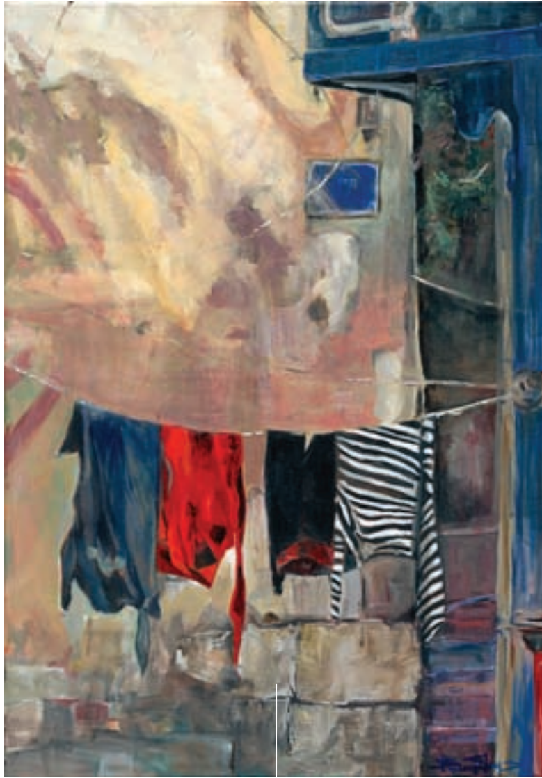
Η Πλύση ακρυλικό σε καμβά, 70 x 100