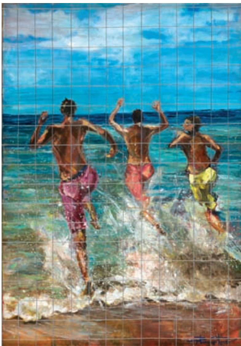
Φυγή προς τα εμπρός ακρυλικό σε καμβά, 70 x 100